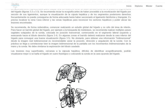
Figura 3.2. Anatomía segmentaria del hígado antes (A) y después (B) de la sección de sus ligamentos y movilización.